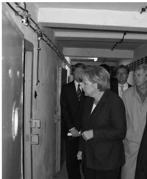
Kanzlerin Merkel im „U-Boot“