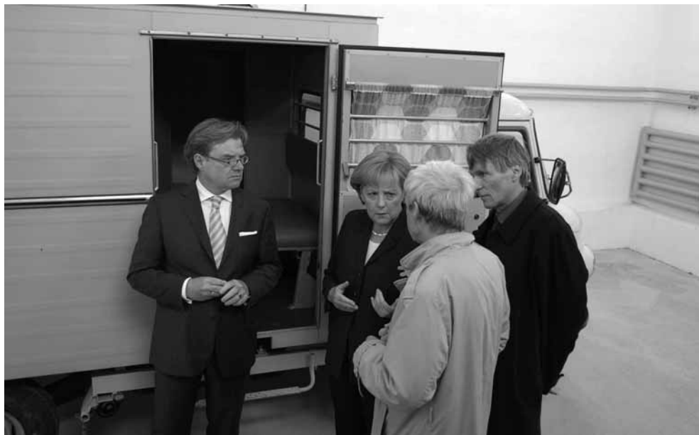
Kanzlerin Merkel vor dem Gefangenentransporter, angekauft vom Förderverein