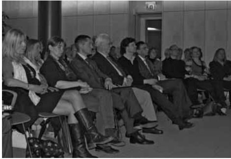
„Volles Haus“ in der LV Thüringen, deren Gastfreundschaft die Gedenkstätte zu schätzen weiß

Ende April ist in der Landesvertretung Thüringen ein einzigartiges Dokument vorgestellt worden, das fast 20 Jahre nicht mehr erhältlich war. Es ist das erstmals 1978 erschienene Buch „Vernehmungsprotokolle“ des DDR-Schriftstellers Jürgen Fuchs, das die Gedenkstätte Berlin-Hohenschönhausen aus Anlass seines zehnten Todestages neu