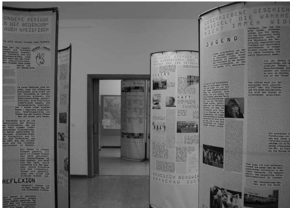
Ein Blick in die Ausstellung „Ganz normale Helden“