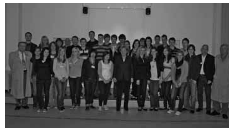
Kanzlerin Merkel mit der Schulklasse

Der Eindruck der Betroffenheit vermittelt sich auch während des Gesprächs der Kanzlerin mit ehemaligen Häftlingen,