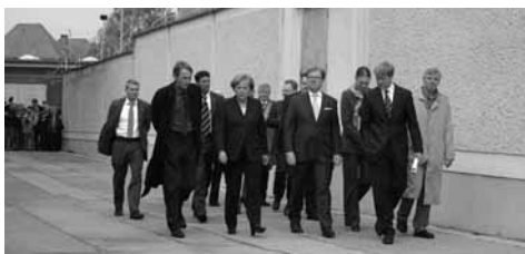
Kanzlerin Merkel während des Rundgangs