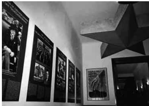
Ausstellungsraum im „Museum des Kommunismus“

Unmittelbar im Zentrum Prags ganz in der Nähe des Wenzelsplatz befindet sich das „Museum des Kommunismus“, das das Leben in der Tschechoslowakei während der kommunistischen Diktatur nachzeichnet. Zu sehen sind gut erhaltene Erinnerungsstücke