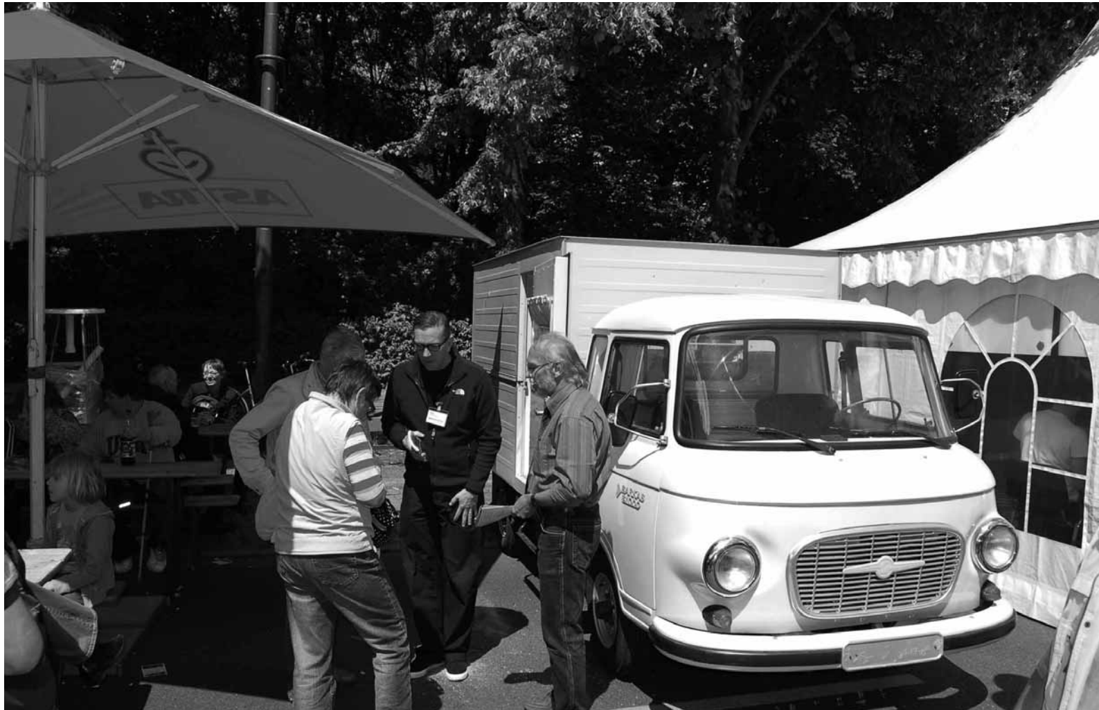
Berlin, Straße des 17. Juni: Die Gedenkstätte präsentiert sich am Verfassungstag

Die Berichte über Willkürjustiz und politische Haft hinterließen bei vielen Besuchern einen deutlich bleibenden Eindruck. 20 Jahre nach der friedlichen Revolution von 1989 ist das Thema Stasi und Aufarbeitung so aktuell wie nie.